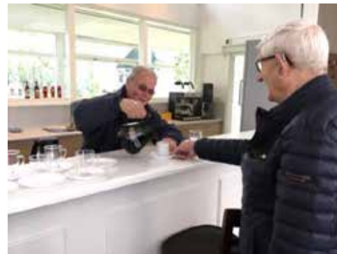
De bardienst is dan ook heel belangrijk!