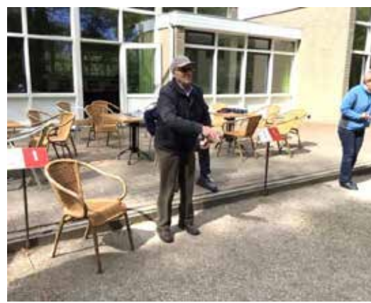
Harm heeft besloten om ivm zijn gezondheid niet meer mee te spelen. Hij wil wel lid blijven.