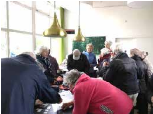
Wachten tot de regen over is!