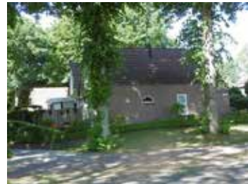
C: Zuidbargerstr. 92