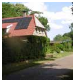
H: Keistraat 77