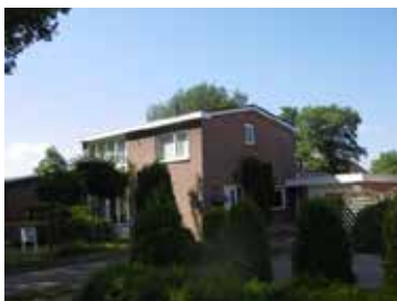
J: Zuidbargerstraat 118