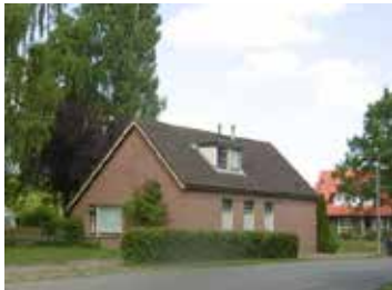
A: Zuidbargerstraat 34

Niks blef zo as het is. Dat is een uitspraak van een bekend zanger, geloof ik. Alles verandert, ook in Zuidbarge . Voor deze prijsvraag hebben we een aantal afbeeldingen van vroeger opgezocht en de plek vanaf ongeveer dezelfde positie opnieuw gefotografeerd. Welke foto's horen bij elkaar? Succes ermee.