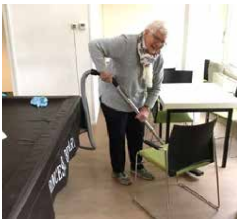
Na afloop wordt alles weer netjes schoongemaakt!