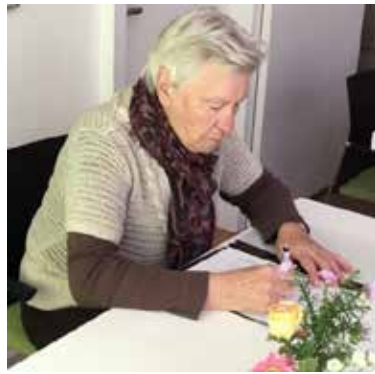
Presentie- en scorelijst worden nauwkeurig bijgehouden