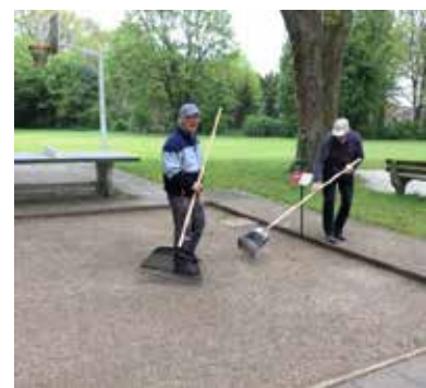
De baan ligt er weer keurig bij!