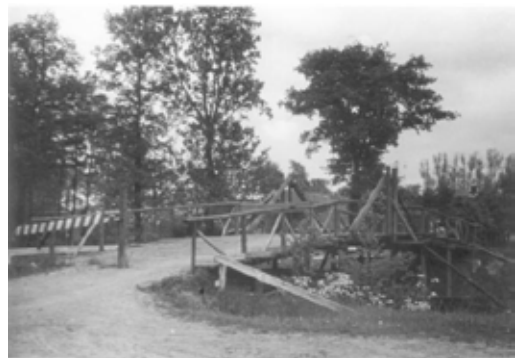
De Kalterenbrug van 1945-1949