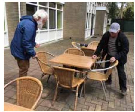
Bij mooi weer worden de terrasstoelen losgemaakt