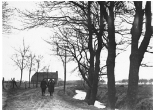
Achter de molen met een restant van het riviertje De Delft.