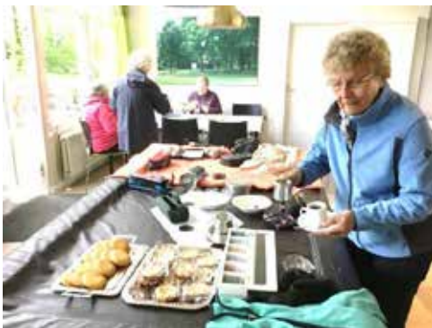
Tijd voor koffie en altijd wat lekkers