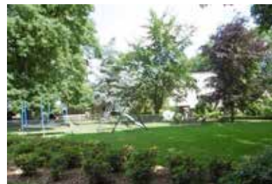
I: Rietlandenstr. 74