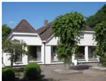
D: Zuidbargerstr. 110