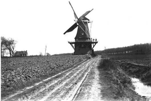
De molen in het begin van de 20e eeuw

Een andere activiteit van de werkgroep is het beheren van het dorpsarchief. In het dorpshuis staat een brandbestendige kast met daarin een groot aantal foto's en documenten met betrekking tot Zuidbarge. Op de facebookpagina "Zuidbarge Toen en Nu" worden vrijwel dagelijks daarvan een paar gepubliceerd.