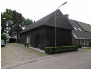
E: Rietlandenstr. 13