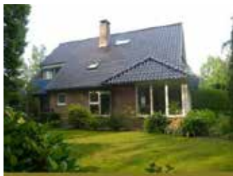
G: Zuidbargerstraat 77