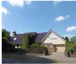
B: Zuidbargerstraat 82