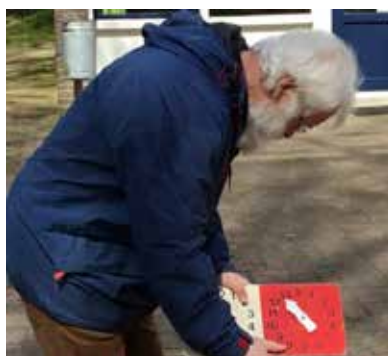
Albert de score bordjes moeten ook nog!