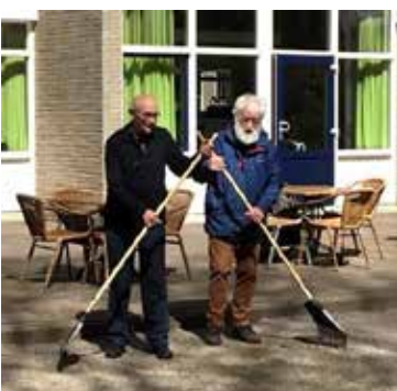
Zo komt de baan niet klaar!