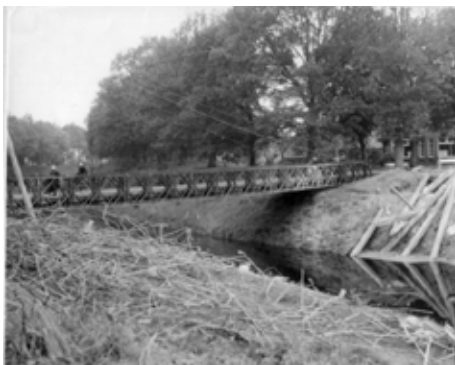
De baileybrug bij Meppelink van 1945 tot 1954