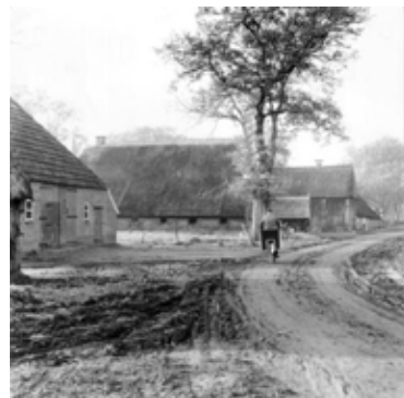
Het oostelijke stukje Rietlandenstraat de hanebietershoek