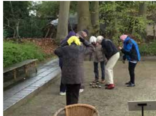
Soms wordt er ook doorgespeeld!